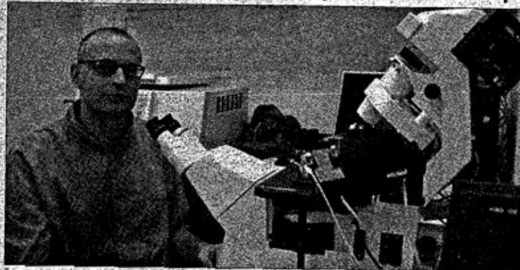
ЛАБОРАТОРИЈА Научноистраживачки рад није запостављен